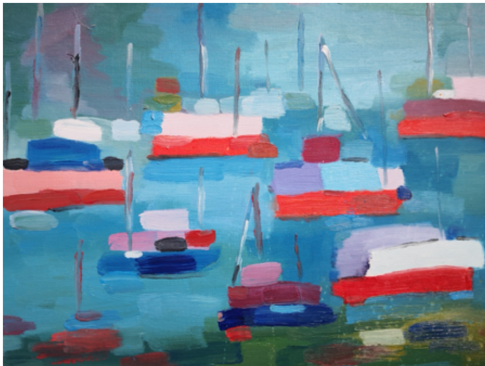
« Embarcations à l'ancre » Jolanda Malamem, 1991